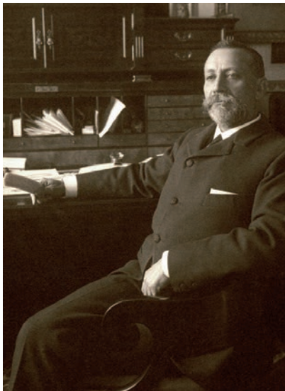
Le Prince Albert I er de Monaco à son bureau, 1907.

Le prince Albert I er , convaincu que les arts et la science sont au service de la vérité et de la paix, a donné, dès son avènement en 1889, une vive impulsion à l'activité musicale. Il a pu bénéficier pour cela de ses liens privilégiés avec des compositeurs comme Jules Massenet et Camille Saint-Saëns, ses confrères à l'Institut de France, avec qui il entretient des liens amicaux nourris d'une riche correspondance et de séjours réguliers au palais princier. Les deux musiciens ont contribué au rayonnement de la principauté, notamment grâce à deux œuvres, La Nef triomphale (Massenet) et Ouverture de fête (Saint-Saëns), créées pour l'inauguration du Musée océanographique (1910). Plus tard, Saint-Saëns, également ouvert au développement de la connaissance, particulièrement dans le domaine des sciences naturelles – Le Carnaval des animaux en est une belle illustration sonore -, salue l'« admirable discours » par lequel le prince a inauguré l'Institut de Paléontologie humaine et prévoit « qu'à l'avenir l'éclat de la Couronne du Prince sera éclipsé par l'auréole du savant » (lettre de Saint-Saëns à Albert I er , 3 janvier 1921). En ce début de saison 2021/2022, alors qu'un double anniversaire réunit les deux hommes (on commémore en 2021 le centenaire de la disparition du musicien et en 2022 celui du prince) célébrer leur amitié fait donc particulièrement sens.