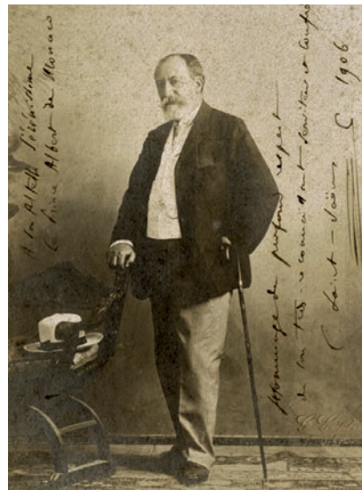
Camille Saint-Saëns, 1906.