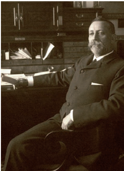
Le Prince Albert I er de Monaco à son bureau, 1907.

Le prince Albert I er , convaincu que les arts et la science sont au service de la vérité et de la paix, a donné, dès son avènement en 1889, une vive impulsion à l'activité musicale. Il a pu bénéficier pour cela de ses liens privilégiés avec des compositeurs comme Jules Massenet et Camille Saint-Saëns, ses confrères à l'Institut de France, avec qui il entretient des liens amicaux nourris d'une riche correspondance et de séjours réguliers au palais princier. Les deux musiciens ont contribué au rayonnement de la principauté, notamment grâce à deux œuvres, La Nef triomphale (Massenet) et Ouverture de fête (Saint-Saëns), créées pour l'inauguration du Musée océanographique (1910). Plus tard, Saint-Saëns, également ouvert au développement de la connaissance, particulièrement dans le domaine des sciences naturelles – Le Carnaval des animaux en est une belle illustration sonore -, salue l'« admirable discours » par lequel le prince a inauguré l'Institut de Paléontologie humaine et prévoit « qu'à l'avenir l'éclat de la Couronne du Prince sera éclipsé par l'auréole du savant » (lettre de Saint-Saëns à Albert I er , 3 janvier 1921). En ce début de saison 2021/2022, alors qu'un double anniversaire réunit les deux hommes (on commémore en 2021 le centenaire de la disparition du musicien et en 2022 celui du prince) célébrer leur amitié fait donc particulièrement sens.